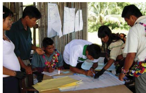
Mapeo participativo con las comunidades shawi, Santa María de Cahuapanas, Perú. Fotografía: Sarah-Lan Mathez-Stiefel, 2007.

Como parte de las actividades realizadas durante los congresos, generalmente, se llevan a cabo talleres pre y post congreso, además de capacitaciones en temas relacionados con la etnobiología. A través de la ISE pueden obtenerse subvenciones para los viajes de participantes indígenas. Las organizaciones interesadas en fungir como sede para un futuro congreso pueden encontrar mayores detalles en el sitio web de la Sociedad ( www.ethnobiology.net ).