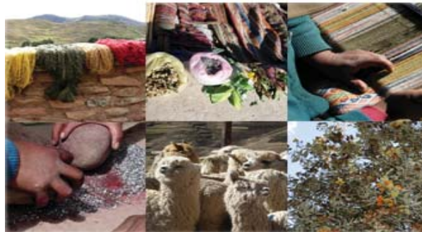
Tejido tradicional con tintes naturales y lana de alpaca en el distrito de Pitumarca, Perú.

*Se requiere una carta dirigida previamente a la Junta Directiva de la ISE.